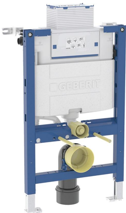
Fig. 2 Geberit Duofix Omega Figur: Geberit AS