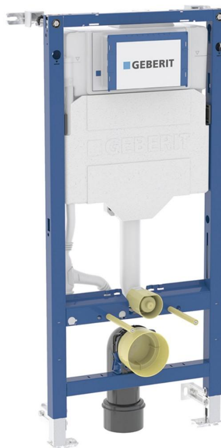
Fig. 1 Geberit Duofix Sigma Figur: Geberit AS

Duofix Sigma og Duofix Omega innbyggingsystemer kan benyttes i badetrom og toalettrom der man ønsker skjult montering av systerne. Når innbyggingsystemet monteres som beskrevet i pkt. 6, vil systemet tilfredsstillende krav til vedlikehold og utskifting av systerne, sikkerhet mot eventuell lekkasje og synliggjøring av eventuelt lekkasjevann.